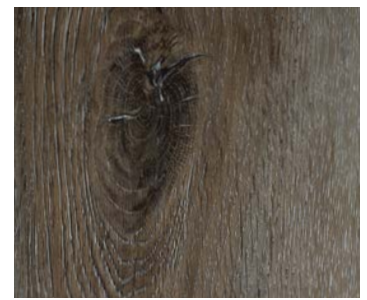
6104 MIST OAK / CHÊNE BROUILLARD