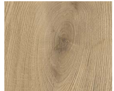
6113 REFLECTION | RÉFLEXION