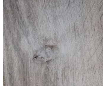
6108 TEMPEST OAK / CHÊNE TEMPÊTE