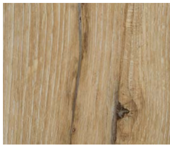
6102 AURORA OAK / CHÊNE AURORE