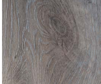
6107 HAZE OAK / CHÊNE BRUME