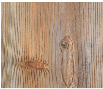
6100 SUNSET HICKORY / HICKORY SUNSET