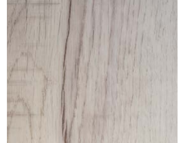
6109 POLAR MAPLE / ÉRABLE POLAIRE