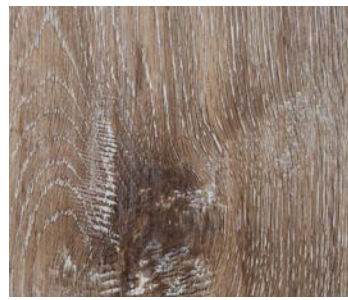
6103 ZEPHYR OAK / CHÊNE ZÉPHYR