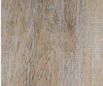
6106 CHINOOK MAPLE / ÉRABLE CHINOOK