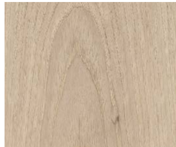
6112 DAZZLE | ÉBLOUI