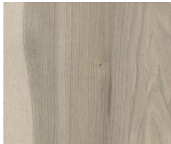
6111 GREYSTOKE | GREYSTOKE