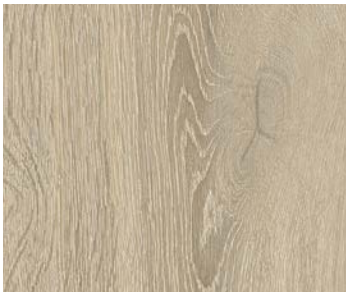
6110 SKYRISE | GRATTE-CIEL