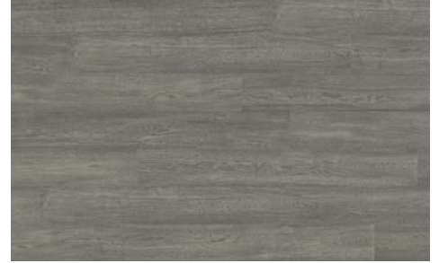
Silhouette I Silhouette 5706RS (Oak / Chêne) 7mm x 6.5" x 48" (Random/Aléatoire)