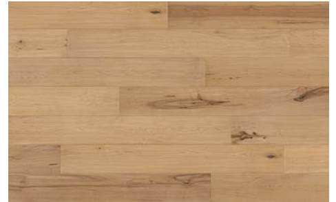
Reflection I Réflexion 5709RS (Maple / Érable) 7mm x 6.5" x 48" (Random/Aléatoire)