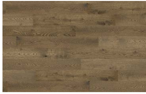
Aura I Aura 5701RS (Oak / Chêne) 7mm x 6.5" x 48" (Random/Aléatoire)