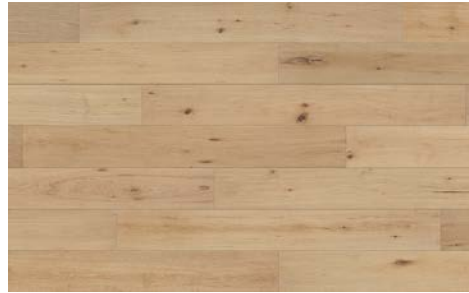
Marvel I Merveille 5708RS (Oak / Chêne) 7mm x 6.5" x 48" (Random/Aléatoire)