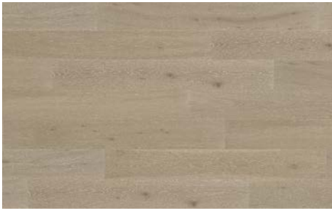
Zenith I Zénith 5700RS (Oak / Chêne) 7mm x 6.5" x 48" (Random/Aléatoire)