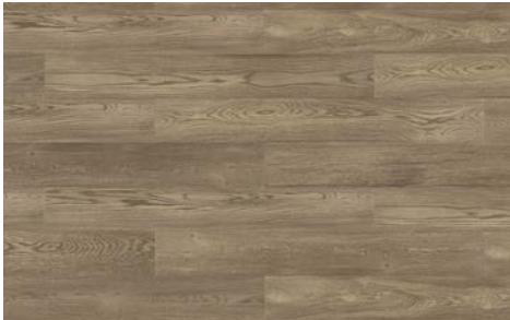
Splendor I Splendeur 5707RS (Oak / Chêne) 7mm x 6.5" x 48" (Random/Aléatoire)