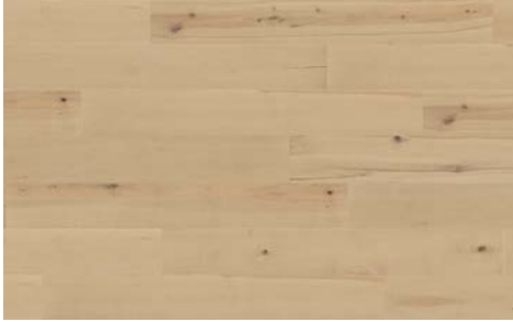
Tranquil I Tranquille 5704RS (Maple / Érable) 7mm x 6.5" x 48" (Random/Aléatoire)