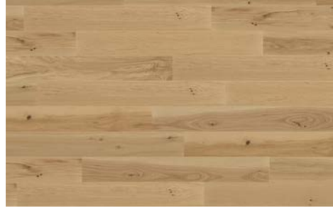
Epoch I Époque 5705RS (Hickory / Hickory) 7mm x 6.5" x 48" (Random/Aléatoire)