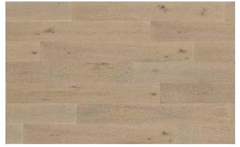
Demure I Sage 5702RS (Oak / Chêne) 7mm x 6.5" x 48" (Random/Aléatoire)