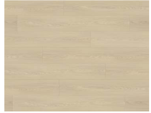
Facet | Facette 8202DS