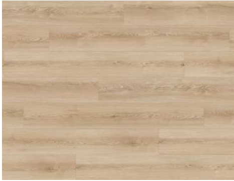
Lustrous | Brillant 8203DS