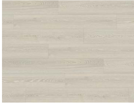
Aspect | Aspect 8201DS