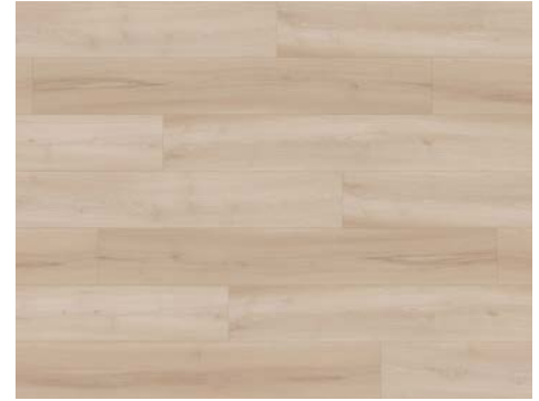
Dreamy | Rêveuse 8205DS