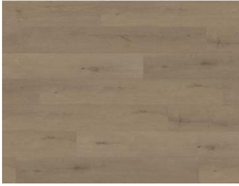
Vista | Vista 8200DS