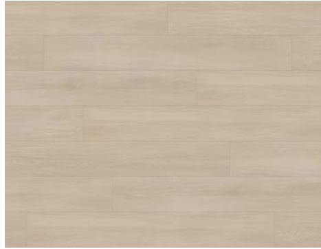
Airy | Aérée 8204DS