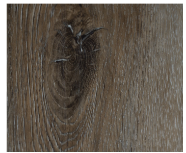
6104 MIST OAK / CHÊNE BROUILLARD