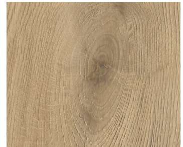
6113 REFLECTION | RÉFLEXION