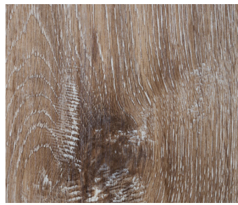
6103 ZEPHYR OAK / CHÊNE ZÉPHYR