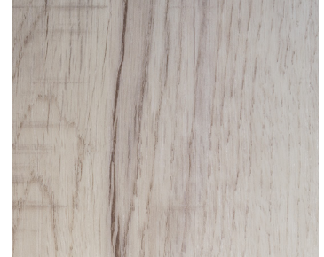
6109 POLAR MAPLE / ÉRABLE POLAIRE