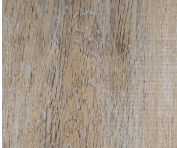
6106 CHINOOK MAPLE / ÉRABLE CHINOOK