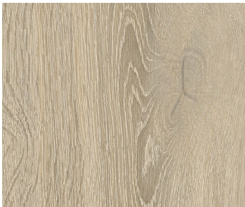
6110 SKYRISE | GRATTE-CIEL