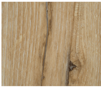
6102 AURORA OAK / CHÊNE AURORE