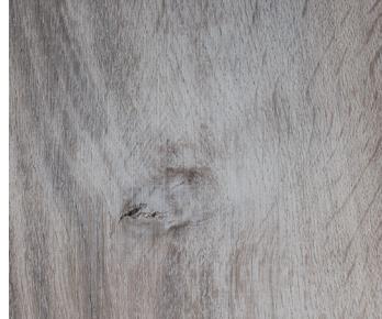
6108 TEMPEST OAK / CHÊNE TEMPÊTE