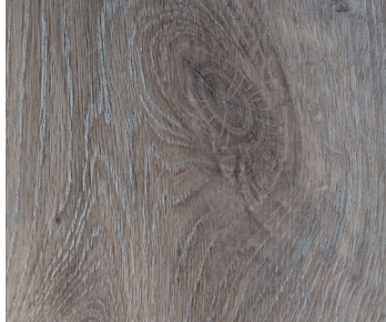
6107 HAZE OAK / CHÊNE BRUME