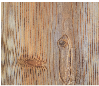
6100 SUNSET HICKORY / HICKORY SUNSET