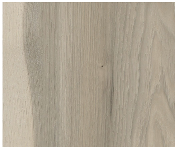
6111 GREYSTOKE | GREYSTOKE